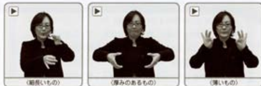
同じ細長いものといっても、鉛筆、電柱とひもではあらわし方が違いま

手話においても、細長いもの、厚みのあるもの、薄い紙片などをあらわす決まった方法があります。これは世界中の手話に共通のルールだといってもいいでしょう。